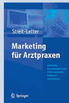
Marketing für Arztpraxen